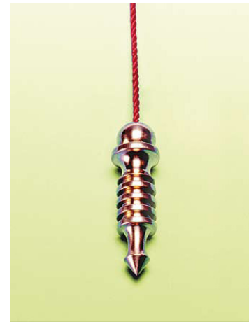
Pendule Weber-Isis Laiton plaqué or Longueur du pendule : 5 centimètres Poids : 26 grammes Longueur de corde : env. 26 centimètres

Le pendule Weber-Isis est rempli de sable de quartz, de coton naturel et de cire, et fonctionne comme un mini émetteur d'Orgone. Plaqué or, il utilise également la haute fréquence de ce noble métal. La forme du pendule, dont le rayonnement est renforcé par une "pile" de quatre nervures, assure une sensibilité élevée et une grande puissance.