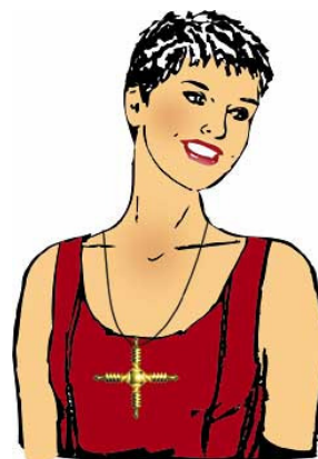
Port correct de l'Amulette Isis

La Croix Isis ne remplace pas le Beamer Weber-Isis et ne possède pas ses propriétés d'harmonisation spécifiques.