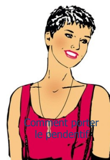
Comment porter le pendentif